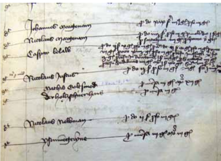
Geschossbuch 1426, Ratsarchiv Görlitz

Anhand eines im 3-D-Druckverfahren hergestellten Architekturmodells, seziiert in Vertikalschnitte, wird die raffinierte Anatomie der Häuser sichtbar und verständlich.