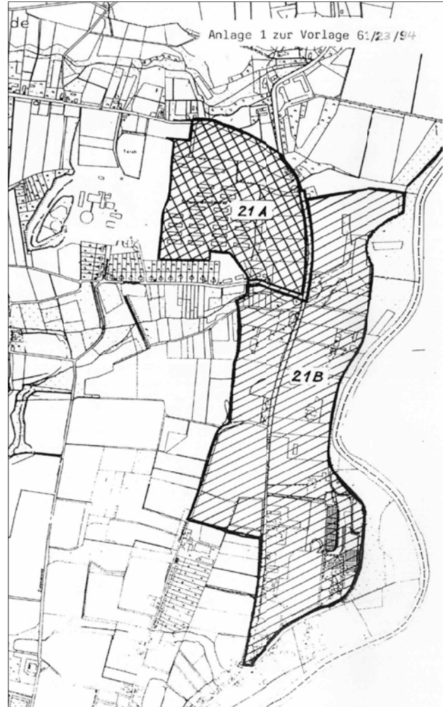
Übersichtsplan 2 - unmaßstäblich -