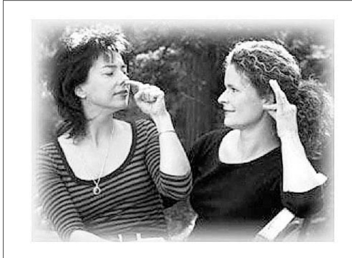
„Mehr Stolz, ihr Frauen!“ ...sieht so in Gebärdensprache aus

Ort: NeisseGalerie Görlitz, Elisabethstraße 10 - 11, bis 29.03.2012 Wann: Eintritt frei!