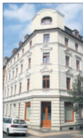
Glanzecke Sohrstraße/Ecke Emmerichstraße

Glanz und Elend von Eckgebäuden liegen eng beisammen. Neben vielen Handicaps bieten die Ecken aber auch ungeahnte Chancen.