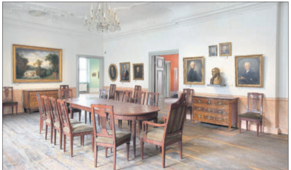
Großer Versammlungsraum der OLGdW um

Im Graphischen Kabinett beherbergt das Haus eine bedeutende Sammlung von Druckgraphik, Handzeichnungen und Aquarellen des 15. Jahrhunderts bis zur Gegenwart. Außerdem befindet sich hier die Oberlau-