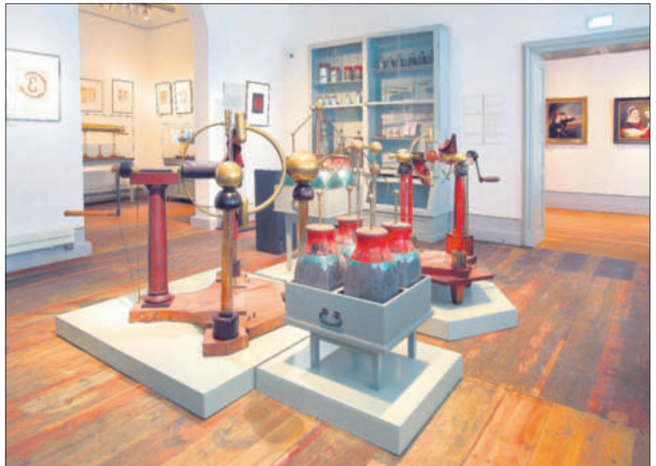
Blick ins Physikalische Kabinett