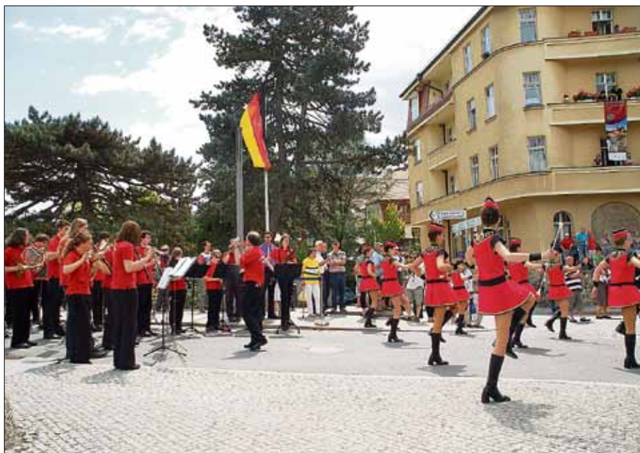
Jugendblasorchester Görlitz mit Tanzgruppe der Tschechischen Tanzschule „Bonifac“