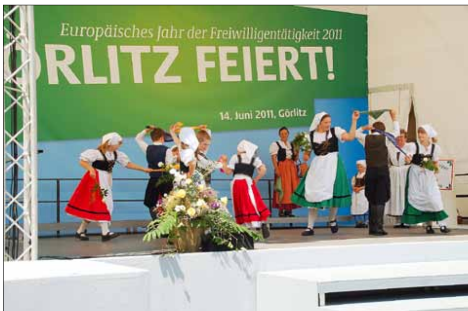
Tanz der Schlesischen Trachtengruppe St. Hedwig auf der Bühne