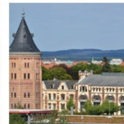
Industriekultur und Industrieerbe der Südstadt

Die Görlitzer Südstadt verkörpert die Entwicklung und den Gründergeist des 20. Jahrhunderts der die vielen Strassenzüge aber auch die vielen öffentlichen Grünanlagen der Süd-Stadt bis heute prägt. Die Kunnerwitzer, der Sechsstädteplatz, Landekronbrauerei, der Villengürtel Holteistraße sind auch bei den Filmleuten immer wieder gern genutzte Kulisse in der Südstadt. Bild: Dreh zu 'Jeder stirbt für sich allein' auf der Kunnerwitzer (2015)