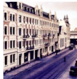
Die Strassenzüge der Südstadt sind zuweilen Filmkulisse

Die Görlitzer Südstadt verkörpert die Entwicklung und den Gründergeist des 20. Jahrhunderts der die vielen Strassenzüge aber auch die vielen öffentlichen Grünanlagen der Süd-Stadt bis heute prägt. Die Kunnerwitzer, der Sechsstädteplatz, Landekronbrauerei, der Villengürtel Holteistraße sind auch bei den Filmleuten immer wieder gern genutzte Kulisse in der Südstadt. Bild: Dreh zu 'Jeder stirbt für sich allein' auf der Kunnerwitzer (2015)