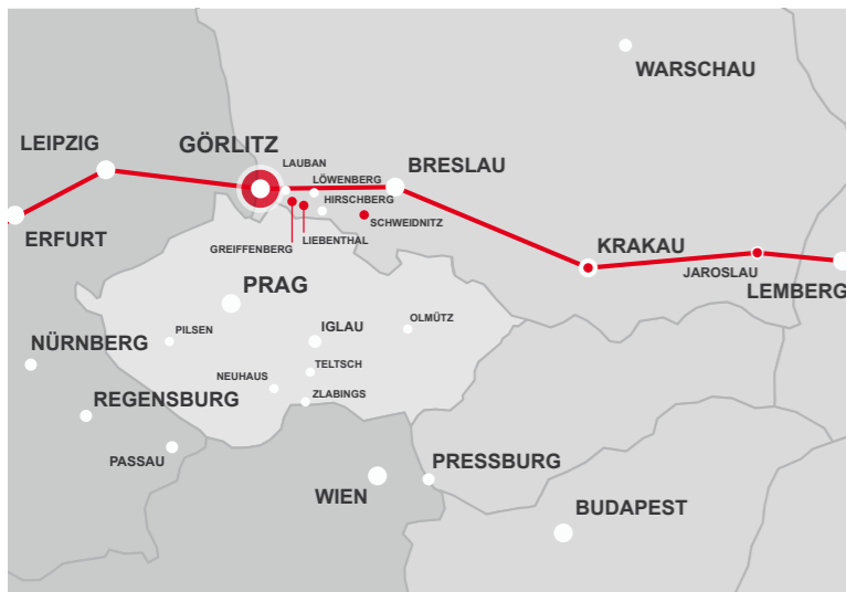
Geographische Verbreitung noch erhaltener Bürgerhäuser mit zentralen Belichtungs- und Treppenhallen nach Vor-Ort-Überprüfung 2013 entlang der via regia zwischen Görlitz und Jaroslau. (Zeichnung: Frank-Ernest Nitzsche, 2013)

Die Lage am Flussübergang der Lausitzer Neiße förderte die rasche Entwicklung der Stadt. Vor allem durch Waidhandel, Tuchherstellung und -export sowie stattliche Privilegien stieg Görlitz im Spätmittelalter zur bedeutendsten Handelsstadt zwischen Erfurt und Breslau auf.