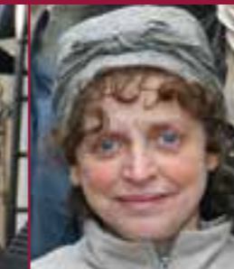
zleva: Brandon Gleeson, Florian David Fitz, Katharina Thalbach