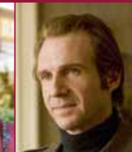
zleva: Jan Josef Liefers, Jackie Chan, Ralph Fiennes