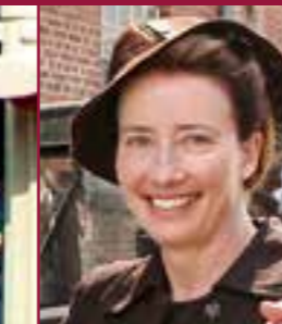
zleva: David Kross, Kate Winslet, Emma Thompson