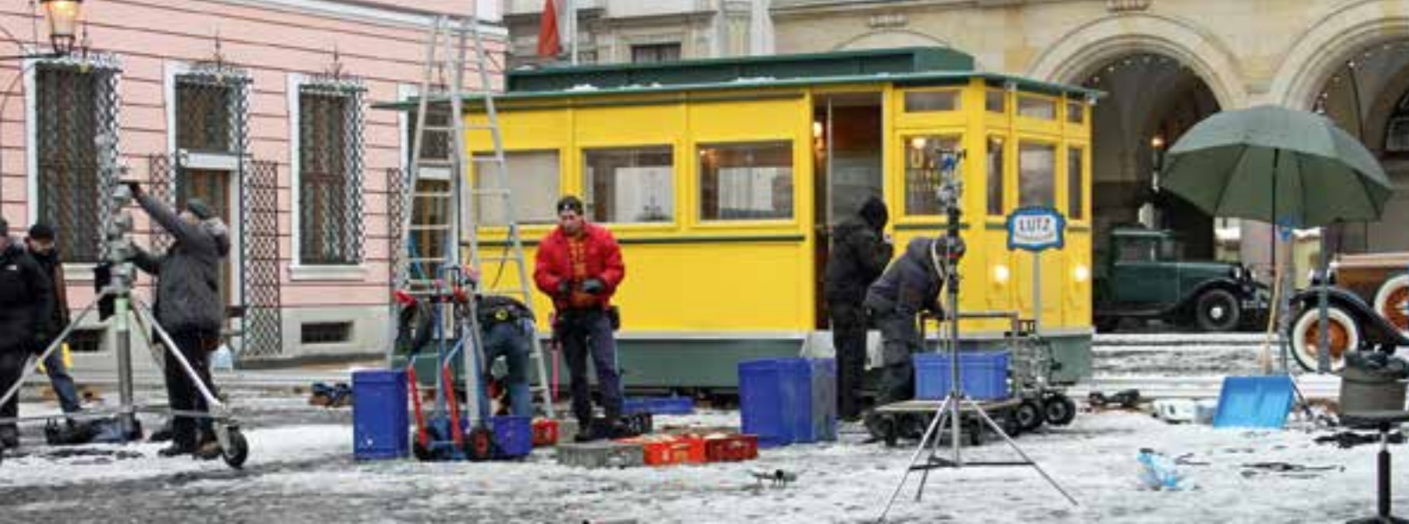
Filmová scéna pro film „Grandhotel Budapešť“ před radnicí v Görlitz.