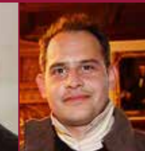
zleva: Daniel Brühl, Jeff Goldblum, Moritz Bleibtreu