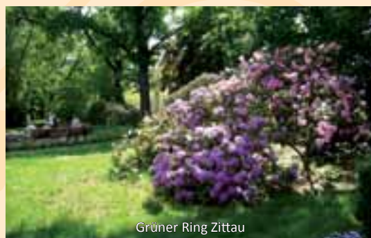
Grüner Ring Zittau