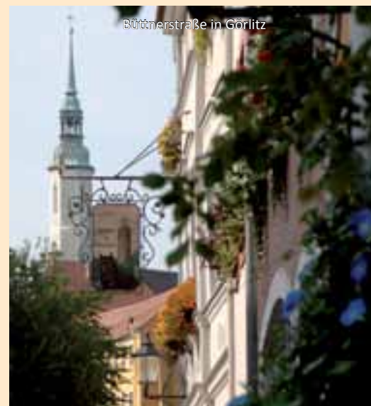
Blüthenstraße in Görlitz

Sie haben technische Probleme mit Ihrem Rad? Dann nutzen Sie die Fahrradservicepunkte entlang des Oder-Neiße-Radweges.