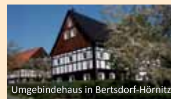
Umgebendehaus in Bertsdorf-Hörnitz