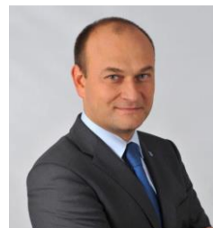
Rafal Gronicz Bürgermeister Zgorzelec