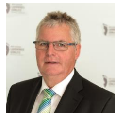
Landrat Bernd Lange