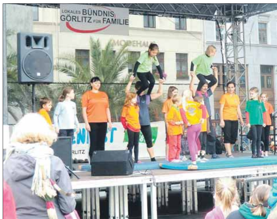
Zum Bühnenprogramm gehörte der Auftritt der Akrobatikgruppe von der Dietrich Heise Schule

Darüber hinaus sind interessierte Görlitzerinnen und Görlitzer eingeladen, sich bei den monatlichen Bündnistreffen oder im Familienforum aktiv zu beteiligen und gemeinsam eine starke Stimme für Görlitzer Familien zu bilden.