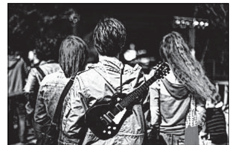
Das „fokus Festival 2013“ feierte einen Besucherrekord

Gefördert und unterstützt wurde das Veranstaltungsprogramm u. a. von der Kulturstiftung des Freistaates Sachsen, dem Fonds Soziokultur, dem Deutsch-Polnischen Jugendwerk, der Stadt Görlitz, der Stadt Zgorzelec, der Stiftung Lausitzer Braunkohle, dem Polnischen Institut Leipzig sowie dem Lokalen Aktionsplan im Landkreis Görlitz (kurz LAP) im Rahmen des Bundesprogramms „Toleranz fördern - Kompetenz stärken“.