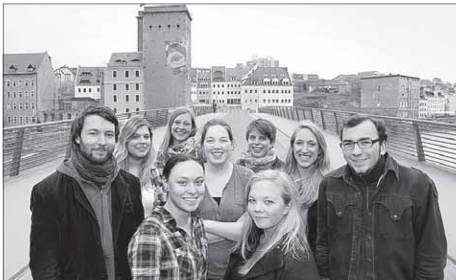
Kulturkombinat 15° e. V. organisiert Konzerte im Basta!

Finanziell kann man den Verein jederzeit unter folgenden Kontodaten unterstützen: Sparkasse Oberlausitz-Niederschlesien Konto-Nr.: 3 100 011 251 BLZ: 850 501 00