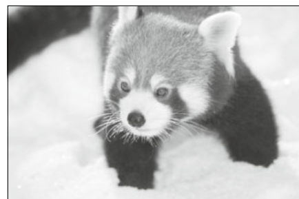
Roter Panda im Schnee

hin täglich ab 08:00 Uhr besuchen und Freundeskreismitglieder bereits schon ab 07:00 Uhr.