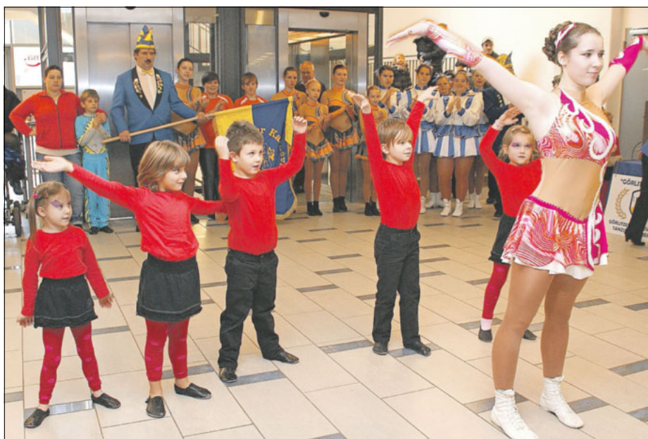
Die kleinen Nachwuchstänzerinnen und -tänzer sind im Programm des GKV mit einbezogen.

Mit einem Programm, bei dem sich die Zuschauer vom tänzerischen und akrobatischen Können der kleinen und großen Tänzerinnen und Tänzer noch einmal bezaubern lassen können, wird die diesjährige sogenannte 5. Jahreszeit verabschiedet.