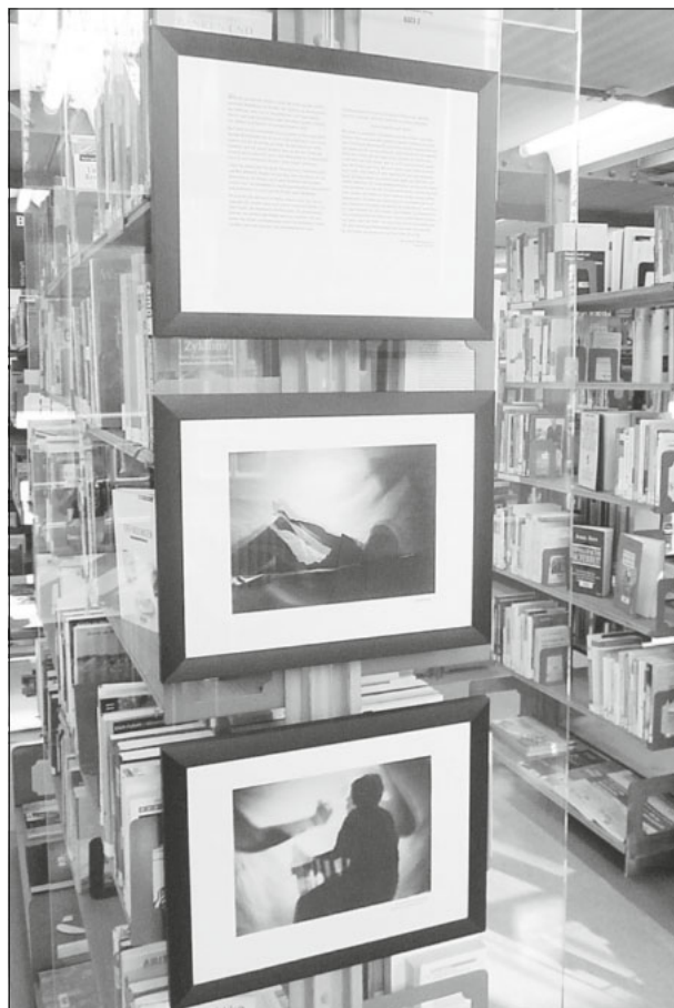
Die Ausstellung war bis vor einigen Tagen in der Görlitzer Stadtbibliothek zu sehen.