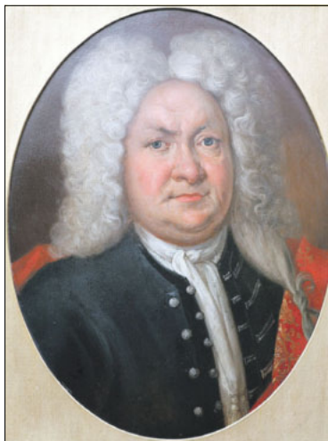
Gemälde Christian Hänisch, Anonym

30 gefragt. Im Mittelpunkt der Ferienveranstaltung „Wenn es knallt und Funken sprühen. Historische Experimente im Physikalischen Kabinett“ steht das Physikalische Kabinett des Adolf Traugott von Gersdorf mit all seinen vielfältigen originalen Apparaten und Instrumenten.