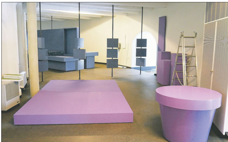
Blick in die erste Ausstellungsetage

Bis dahin wird das Kulturhistorische Museum regelmäßig über den Aufstellungsaufbau berichten und auf www.museum-goerlitz.de aktuell Einblick in das Geschehen geben.