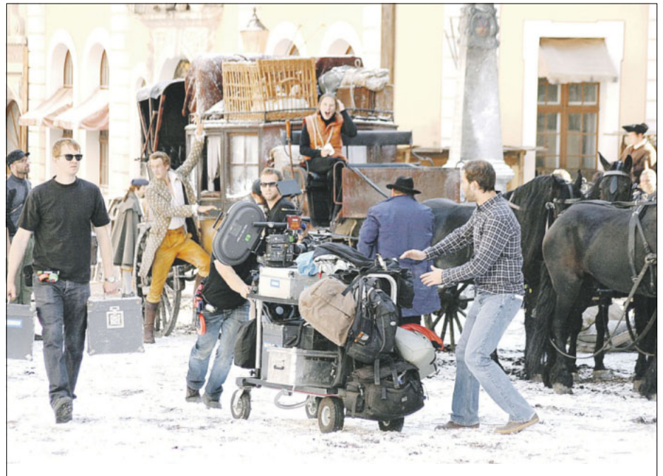
Auf dem Görlitzer Untermarkt wurden Szenen für die Kinoproduktion „Goethe!“ im September 2009 gedreht.