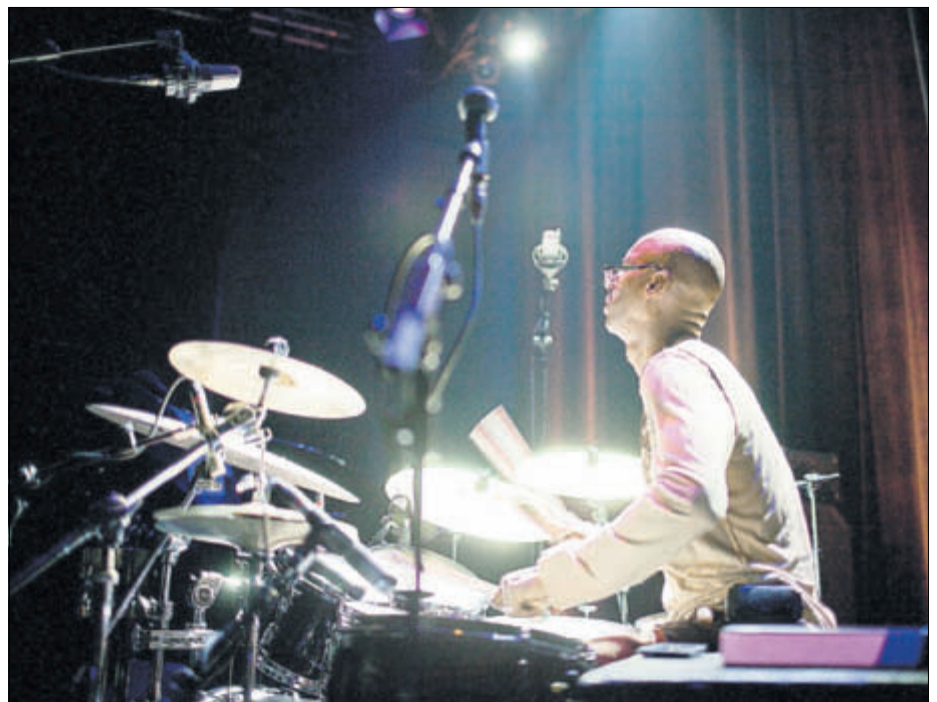
Omar Hakim in The Trio of Oz