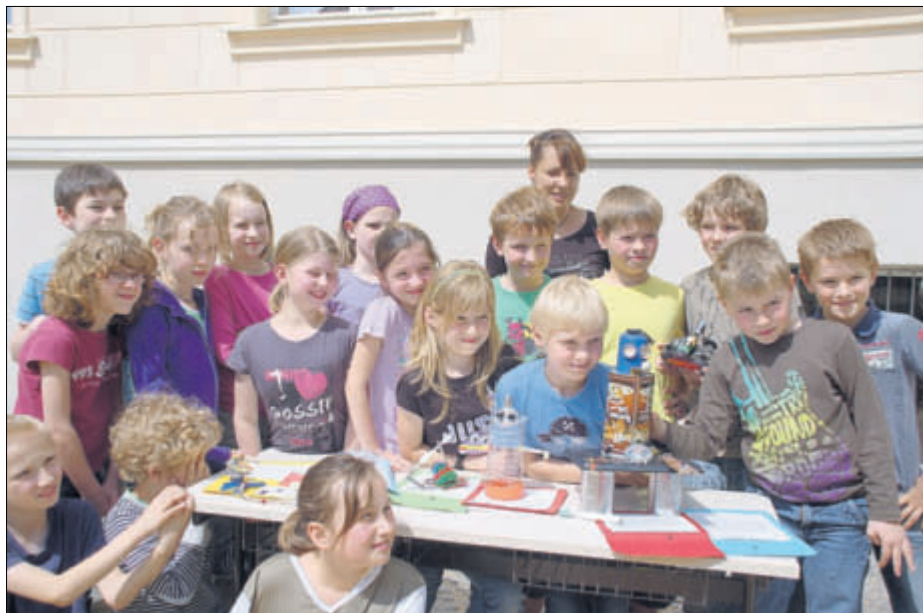
Mädchen und Jungen der Klasse 3b präsentieren ihre Erfindungen

An dem vom Landesarbeitsgemeinschaft für Jugendzahnpflege des Freistaates Sachsen e. V. (LAGZ) ausgelobten Wettbewerb beteiligten sich über 1300 Kinder aus 104 Kindereinrichtungen und Schulen sowie 18 Einzelbewerber mit tollen Beiträgen.