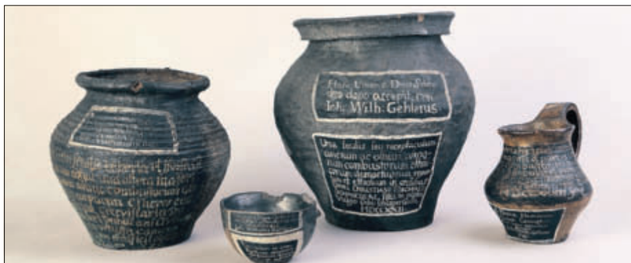
Archäologische Keramiken aus der Milichschen Bibliothek, frühes 18. Jahrhundert

Im Jahr 1779, in der Spätphase der Aufklärungszeit, kamen in Görlitz forschende und wissenschaftlich interessierte Herren zusammen. Sie begründeten „zur Beförderung der Natur- und Geschichtskunde“ die Oberlausitzische Gesellschaft der Wissenschaften. Die Altertumsforschung mit ihren verschiedenen Fachrichtungen Archäologie, Urkundenlehre, Siegelkunde und Münzkunde bildete nur eines der verschiedenen Betätigungsfelder und Sammlungsgebiete. Von archäologischen Funden, und hier besonders von Urnenfunden aus der Nieder- und der Oberlausitz, berichten Chroniken bereits seit dem 16. Jahrhundert. Professionell befassten