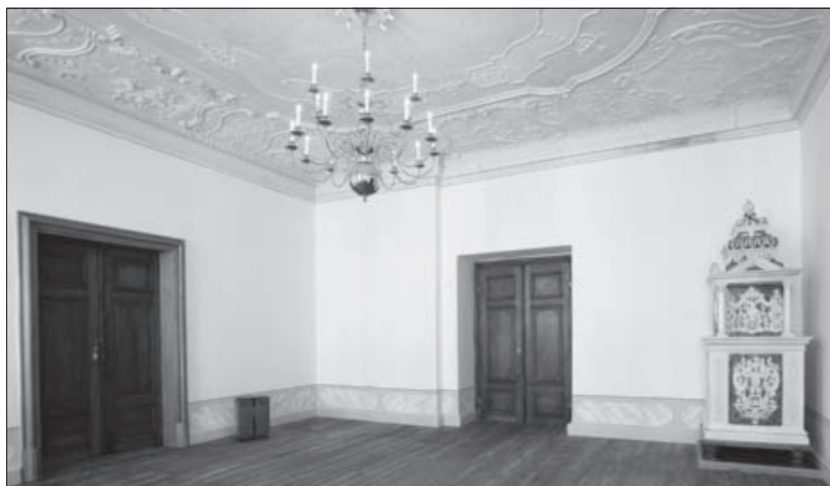
Großer Salon der Ameiß'schen Wohnung