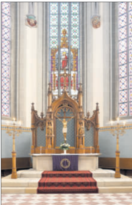
Altar der Frauenkirche

Der Eintritt zu den Veranstaltungen ist frei, Spenden für die Erhaltung der Kirchenbauten sind willkommen.