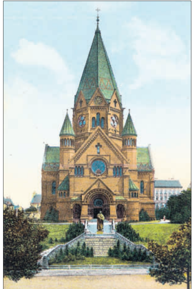
Lutherkirche unmittelbar nach der Weihe

Die Führungen werden in zeitlichen Abständen angeboten, sodass jeder Interessent beide Kirchen besuchen kann. Der Vortrag Welterbebewerbung wird als abschließende Veranstaltung in der Lutherkirche stattfinden. Die Denkmalschutzbehörde freut sich auf zahlreiche Besucher.