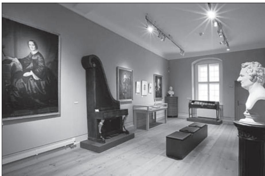
Literatur- und Musikkabinett

Im 2. OG sind die reichen Sammlungen der Oberlausitzischen Gesellschaft der Wissenschaften, die hier ab 1804 residierte, zu sehen. Originale Möbelstücke, wertvolle Gemälde und einzigartige, wissenschaftliche Sammlungen wurden in