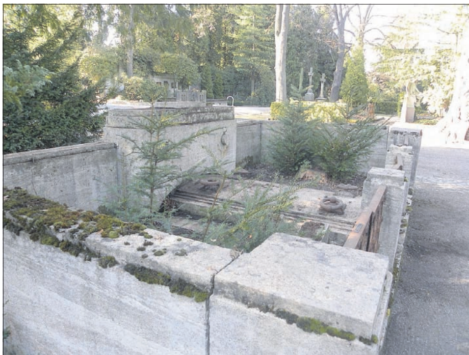
EB Städtischer Friedhof Görlitz, September 2011