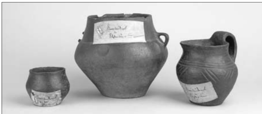
Keramik, etwa 1350 - 900 v. Chr.