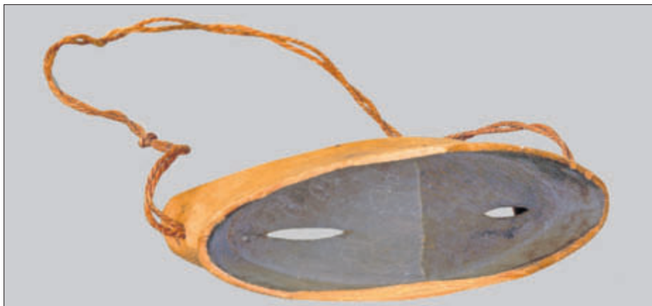
Schneebrille Schweiz, um 1800

Xylotheiken oder „Holz-Cabinette“ wurden erstmals im 18. Jahrhundert angelegt und unter dem Einfluss Carl von Linnés immer mehr systematisiert. In vielen Holzbibliotheken sind die einzelnen „Bücher“ als kleine Kästchen gearbeitet, die Blätter und Früchte der Bäume enthalten. Die Gersdorfsche allerdings besteht nur aus Holz. Das Kulturhistorische Museum Görlitz besitzt gleich zwei dieser Holzbibliotheken, die zu verschiedenen Zeiten gefertigt wurden. Auch die zweite Xylothek stammt aus der Gersdorfschen Sammlung, ist aber noch etwas älter als die erste. Gersdorf hatte sie 1769 auf einer Studienreise vom Rektor der Zwickauer Ratsschule