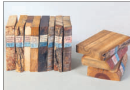
zusammengestellt von Johann Bartholomäus Bellermann, um 1790 (Ausschnitt)

Die „Bücher“ der hier abgebildeten Holzbibliothek sind keine Bücher über Wälder oder Bäume. Holzbibliotheken sind Sammlungen von Hölzern verschiedener Baumarten. Aus dem Stamm der Bäume sind buchförmige Stücke geschnitten. Die Rinde ist als „Buchrücken“ mit einem Etikett beschriftet, auf dem der lateinische Name des jeweiligen Baumes steht.