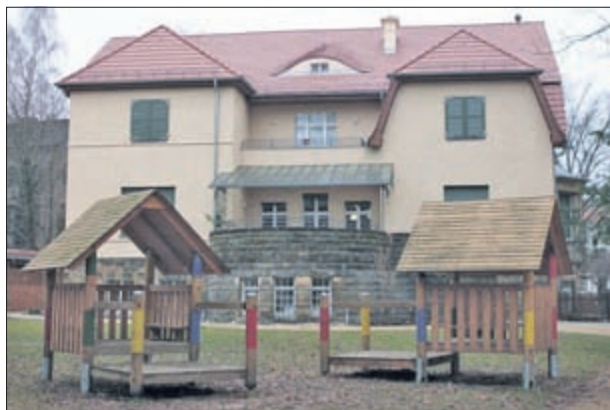
Ansicht des Kindergartens von der Gartenseite

Näheres dazu wird in einer der nächsten Ausgaben des Amtsblattes veröffentlicht.