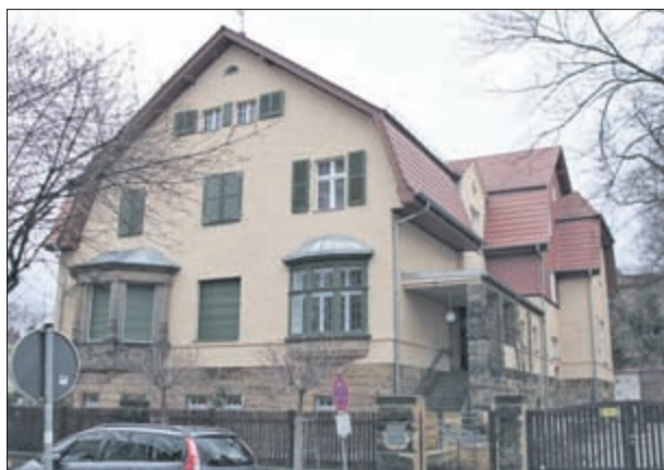
Ansicht des Kindergartens von der Straßenseite