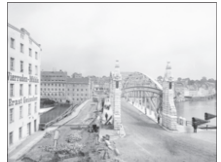
Die Görlitzer Altstadtbrücke, 1907

Östlich der Neiße befinden sich noch heute repräsentative Bauten wie z. B. die Baugewerkschule und die Oberlausitzer Gedenkhalle mit Kaiser-Friedrich-Museum. Letztere wurde 1902 durch Kaiser Wilhelm II. feierlich eröffnet und 1904 der Öffentlichkeit als Kaiser-Friedrich-Museum übergeben. Vorbei am ehemaligen Regimentshaus der Görlitzer Garnison führt der Spaziergang entlang der Bonifatiuskirche bis hin zur Kleistkaserne, die heute mit Wohnungen genutzt wird. Das „Musikerviertel“ auf dem Rabenberg, dessen Straßen heute nach polnischen Komponisten benannt sind, wird durchquert, bevor der Rundgang an der Altstadtbrücke endet.