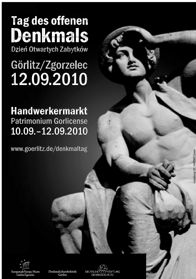
Gedächtnis: DIE PATRIMONIA