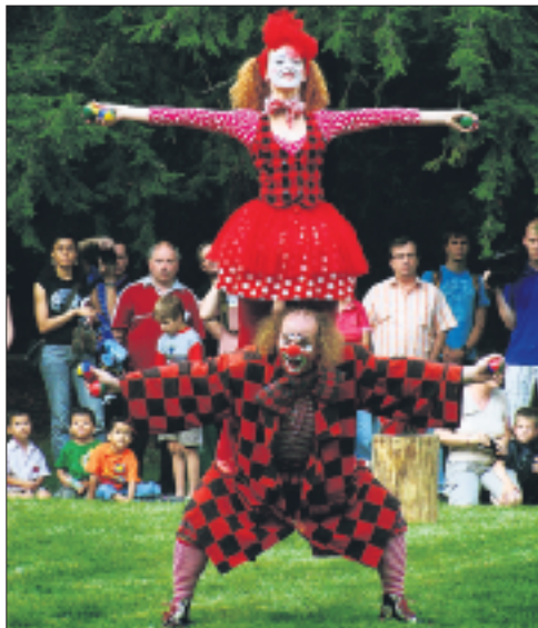
Teatr Pinezka/Peter Hoffmann