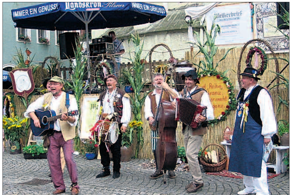
Die Rod'schen Möhrenschaber

Gemeinnutz geht vor Eigennutz, diese Aussage trifft voll auf dich zu. Seit unserer aktiven Zeit in der Wende kenne ich dich und du hast dich nicht geschont oder zurückgelehnt, bist vielmehr Kapitän auf dem Tou-