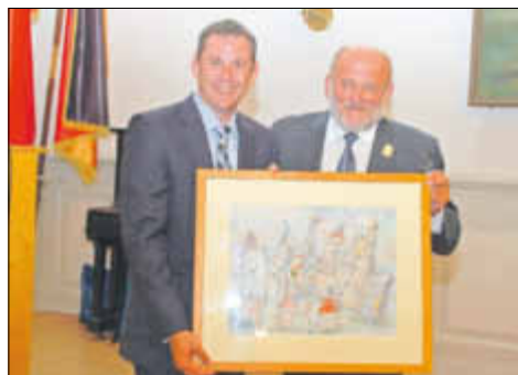
OB Sven Gerich und OB Siegfried Deinege beim Austausch der Gastgeschenke