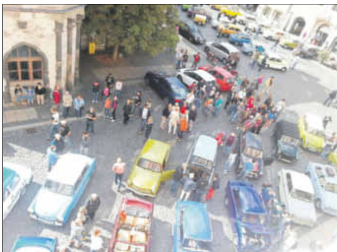
Trabi-Parade auf dem Untermarkt

Vom 4. bis 6. September fand auf dem Rosenhof das nunmehr zweite Görlitzer Trabitreffen statt. Etwa 100 Fahrzeuge waren diesmal angereist.