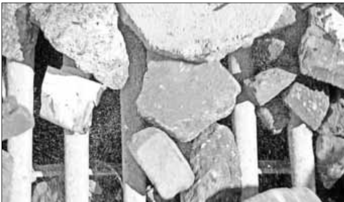
Markus Draper, Videostill aus: „Backenbrecher“, 2015

Sie repräsentieren alltägliche Schauplätze eines bis heute mit Mythen behafteten Kapitels deutsch-deutscher Geschichte. Ausgestattet mit neuen Identitäten, lebten und arbeiteten die ehemaligen Terroristen in Magdeburg, Schwedt, Senftenberg, Neubrandenburg und Berlin. Rückblickend äußerte ein mit ihrer Überwachung beauftragter MfS-Mitarbeiter darüber: „Mit Sicherheit ist es uns