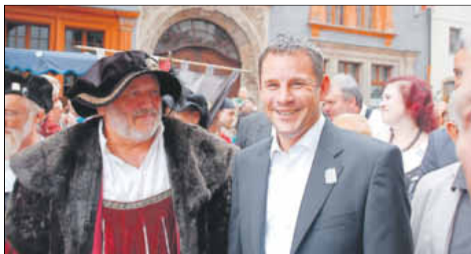
Das Altstadtfest miterleben - OB Siegfried Deinege und OB Sven Gerich im Festgewimmel