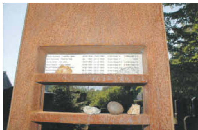
Eine von sieben Namensstelen