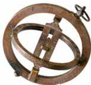
Äquinoktial-Sonnenuhr, um 1720

Ihr erfahrt, was eine Elektrisiermaschine ist und wie man diesem Apparat Funken entlocken kann. Staunen garantiert!