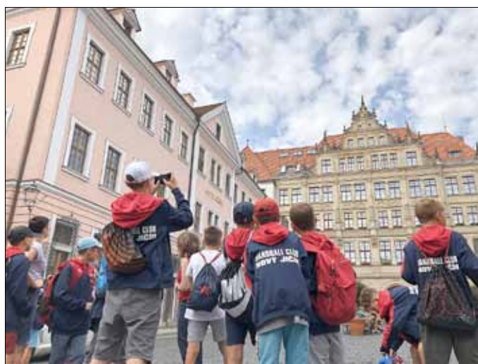
Selbstverständlich gehörte in kleiner Stadtrundgang und ein Empfang im Rathaus dazu.