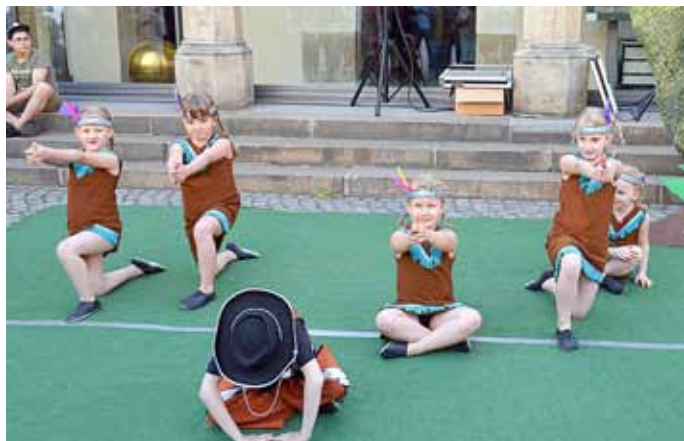
Die Jüngsten waren als Indianer unterwegs.

Ort: Kulturhistorisches Museum Kaisertrutz, Platz des 17. Juni 1, Görlitz