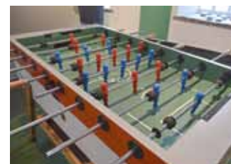
Kickertisch des Görlitzer Kickerkings e. V. in der SPORT SCHAU GÖRLITZ

Die Aktiven beteiligen sich regelmäßig am Ligabetrieb des deutschen Tischfußballbundes bzw. seiner Verbände und spielen nach dessen Regelwerk.